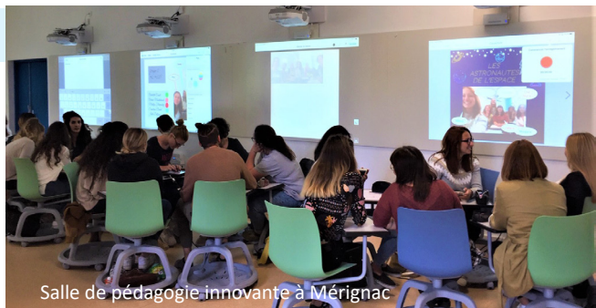
Salle de pédagogie innovante à Mérignac

Les étudiants de la mention 1er degré sont répartis sur les 5 sites de formation de l'INSPÉ : Agen, Bordeaux/Mérignac, Mont de Marsan, Pau et Périgueux.